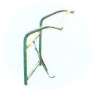
SRTS 上段 5.0kg